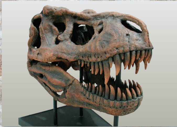
ティラノサウルス(ワールドライフ(株) 寄贈 骨格模型標本)